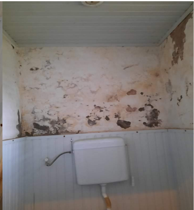
ლანჩხუთში მდებარე უფასო სასადილოს სანიტარიული კვანძი.