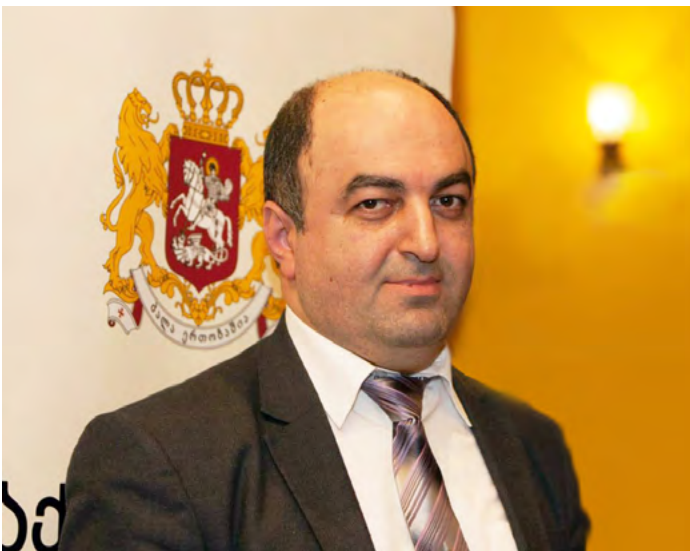
საქართველოს სახალხო დამცველი უკა ნაწუაშვილი

მარტი საპარლამენტო ანგარიშის დასრულებას მოვანდომეთ და მთელი აპარატის ძალისხმევით შედეგად საქართველოს პარლამენტს წარუდგინეთ 633 გვერდ-იანი, საკმაოდ მოცულობითი ანგარიში, რომელიც მიმოიხილავს 2013 წელს ქვეყანაში ადამიანის უფლებათა და თავისუფლებათა დაცვის მდგომარეობას, თავს უყრის საანგარიშო პერიოდში გამოკვეთილ ძირითად ტენდენციებს და შემუშავებულ რეკომენდაციებს. აღსანიშნავია ის გარემოება, რომ 2013 წლის ანგარიშში პირველად შევიდა რამდენიმე თავი. კერძოდ, „პირადი და ოჯახური ცხოვრების ხელშეუხებლობის უფლება“, „ხანდაზმულთა უფლებრივი მდგომარეობა“, „ამნისტია და მსჯავრდებულთა პირობით ვადაზე ადრე გათავისუფლება“, საქართველოს სახალხო დამცველის კანონიერი მოთხოვნის შეუსრულებლობა, „შრომის უსაფრთხოება სამუშაო ადგილებზე“, „ჯანსაღ გარემოში ცხოვრების უფლება“, „ლტოვილთა და თავშესაფრის მაძიებელთა უფლებრივი მდგომარეობა საქართველოში“, „რეპატრიანთა უფლებრივი მდგომარეობა.“ ამ სიახლეების უმთავრესი მიზანია მოვიცვათ ადამიანის უფლებათა შექცევის დაგვარად ფართო სპექტრი და საზოგადოების, ხელისუფლების