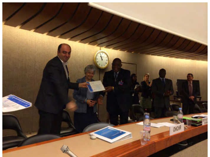
A-სტატუსის დამადასტურებელი სერტიფიკატის გადაცემა

შეხვედრაზე განიხილეს ადამიანის უფლებათა ეროვნული ინსტიტუტების როლი ადამიანის უფლებათა დაცვასა და ხელშეწყობაში; ეკონომიკური; სოციალური და კულტურული უფლებების დაცვა მწირი ფინანსური რესურსებით; ადამიანის უფლებათა ეროვნული ინსტიტუტებისა და საკანონმდებლო ორგანოების თანამშრომლობის შესახებ 2012 წლის ბელგრადის პრინციპები; შეზღუდული შესაძლებლობის მქონე პირთა უფლებების შესახებ გაეროს კონვენციის იმპლემენტაციის მონიტორინგის მექანიზმი და ადამიანის უფლებათა ეროვნული სამოქმედო გეგმების მნიშვნელობა ადამიანის უფლებათა ეფექტური რეალიზაციისთვის. განსაკუთრებული ყურადღება დაეთმო ქალთა უფლებების დაცვასა და ხელშეწყობას.