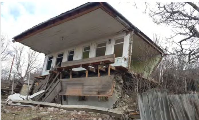
დაზარალებული სასახლარი სოფელ აწყურში

სახალხო დამცველის აპარატი სწავლობს ახალციხის რაიონის სოფელ აწყურში არსებულ ვითარებას. სოფელში 2012 წლის ოქტომბერს მომხდარი მენყერის შედეგად, რვა ოჯახი უსახლკაროდაა დარჩენილი. უსახლკაროდ დარჩენილები ნაქირავებ სახლებში ცხოვრობენ, ბინის ქირას კი მუნიციპალიტეტი ადგილობრივი ბიუჯეტიდან უხდის.