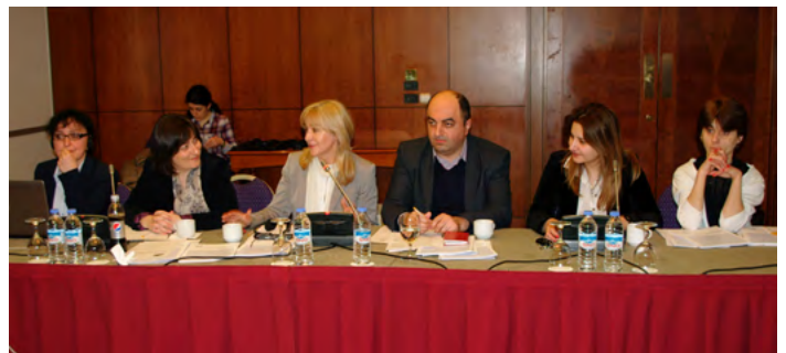
პრაქტიკული „ქოთიარდ მერიტში“

5 მარტს დევნილი შეზღუდული შესაძლებლობების მქონე ქალებისა და შეზღუდული შესაძლებლობების მქონე ქალი მშობლების უფლებების კვლევის პრევენტივით გაიმართა, რომელიც სახალხო დამცველის ოფისისა და გაეროს ერთობლივი პროგრამის „გენდერული თანასწორობის ხელშეწყობისთვის საქართველოში“ მხარდაჭერით ჩატარდა.