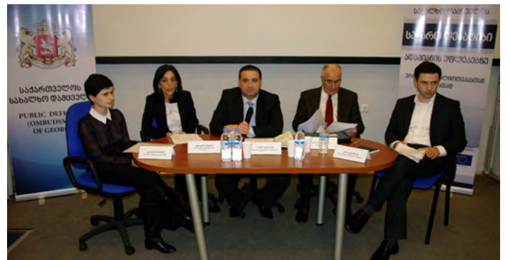
ღებატი რალური კონსტიტუციური კონტროლის შესახებ