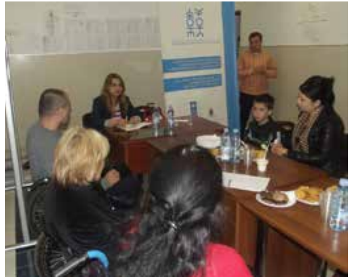
შეხვედრა დუშეთის რაიონში

21-22 და 23 მაისს გაიმართა შეხვედრები დუშეთსა და ყაზბეგის მუნიციპალიტეტებში მცხოვრებ შეზღუდული შესაძლებლობის მქონე პირებთან. ასევე, სოციალური მომსახურების სააგენტოს რაიონული განყოფილებების წარმომადგენლებთან. მონაწილეეს ფსიქიკური პრობლემების მქონე შეზღუდული შესაძლებლობის მქონე ქალების საცხოვრებელი ადგილი სოფელ სნოში , შეხვდნენ ამ პირთა კანონიერ წარმომადგენელს (მეურვეს) და მათი ოჯახის წევრებს.