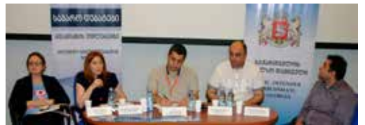
ლეგატი ზავშვის მიმართ ძალადობის თემაზე

დებატებში მონაწილეობა მიიღეს სახელმწიფო უნ- ყებებისა და არასამთავრობო ორგანიზაციების წარმომადგენლებმა, საქართველოს სხვადასხ- ვა უნივერსიტეტების სტუდენტებმა, პრობლემით დაინტერესებულმა საზოგადოებამ.