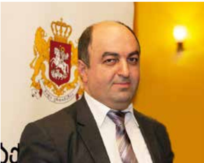
საქართველოს სახალხო დამცველი უჩა ნახუაშვილი

გასული თვის მნიშვნელოვან მოვლენებს შორის მინდა საგანგებოდ გამოვყო საქართველოს სახალხო დამცველისა და გაეროს განვითარების პროგრამის მიერ ორგანიზებული ღონისძიება, სადაც 2008–2013 წლებში ოფისის მიერ გაცემული რეკომენდაციების შესრულების მდგომარეობის თაობაზე დამოუკიდებელი ექსპერტის მიერ ჩატარებული კვლევის პრეზენტაცია შედგა. წინა წლებთან შედარებით, 2013 წელს რეკომენდაციების შესრულების მაჩვენებელი შედარებით მაღალია, თუმცა ვისურვებდი, რომ სახელმწიფო ინსტიტუციები მეტი გულისხმიერებით ეკიდებოდნენ სახალხო დამცველის რეკომენდაციებს.