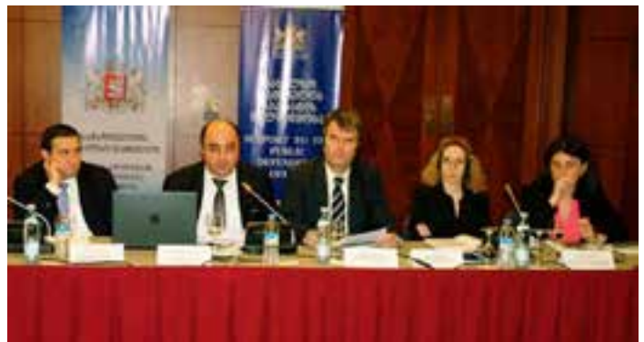
წლიური ანგარიშის პრაეზენტაცია

ევროკავშირის დელეგაციის პირველმა მდივანმა სტეფან სტორკმა საქართველო-ევროკავშირის მჭიდრო ურთიერთობებზე და სამომავლო გეგმებზე საუბრისას აღნიშნა რამდენად მნიშვნელოვანია ადამიანის უფლებათა დაცვის მაღალი სტანდარტის დამკვიდრება, რასაც საქართველოში წარმატებით უძღვება სახალხო დამცველის ინსტიტუტი.