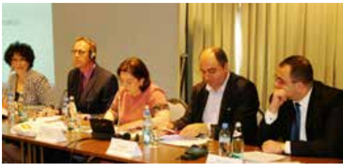
შეხვედრა სასტუმრო „კოლიდაი ინო“

27 მაისს საქართველოს სახალხო დამცველის აპარატისა და გაეროს მოსახლეობის ფონდის (UNFPA) პარტნიორობით ჩატარდა საადვოკაციო შეხვედრა თემაზე: „ადრეულ ასაკში ქორწინების პრევენცია – გენდერული თანასწორობისა და რეპროდუქციული ჯანმრთელობის ხელშეწყობისათვის“. შეხვედრის მიზანს წარმოადგენდა ადრეულ ასაკში ქორწინების პრობლემებით დაინტერესებულ უწყებათა შორის დიალოგის ხელშეწყობა პრობლემის არსის, მიზეზებისა და შედეგების წარმოჩენა და რეკომენდაციების შემუშავება სახელმწიფო პოლიტიკის განსაზღვრისათვის. შეხვედრას ესწრებოდნენ საქართველოს მთავრობის, ადგილობრივი და საერთაშორისო ორგანიზაციების წარმომადგენლები.