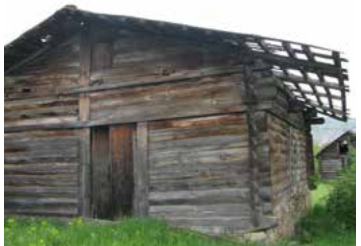
ძეგლ კონსტანტინის კუთვნილი ოსური სახლი 8ა-19 საუკუნის მთავარ ნახევრის ორიგინალი ნიშნითა და ჯაჰის რაიონის სოფელ სოხთალან 1975 წელს არის ჩამოტანილი.

23 მაისს სახალხო დამცველმა რეკომენდაციით მიმართა საქართველოს კულტურისა და ძეგლთა დაცვის სამინისტროს, გიორგი ჩიტაიას სახელობის ეთნოგრაფიული მუზეუმის ადმინისტრაციასთან ერთად განიხილოს მუზეუმში არსებული ოსური სახლის რესტავრაციისა და მათში მუდმივმოქმედი გამოფენის მოწყობის დეტალური ხარჯები და უზრუნველყოს მისი რესტავრაცია.