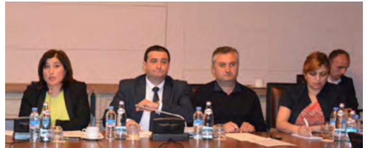
ეთნიკურ უმცირესობათა საბჭოს წევრთა შეხვედრა სესიას მონაწილეობისას

და ეთნიკური უმცირესობებისთვის საარჩევნო უფლებებისა და პროცედურების შესახებ ცენტრალური საარჩევნო ადმინისტრაციის მიერ დაგეგმილ აქტივობებს გაეცნენ. ცესკომ ეთნიკური უმცირესობებით დასახლებულ რეგიონებში სამოქალაქო განათლების, სამოქალაქო ჩართულობის ხელშეწყობის, საარჩევნო პროცედურების შესახებ ახალგაზრდებისთვის საზაფხულო სკოლებში სასწავლო კურსების ჩატარებისა და სხვა საინფორმაციო კამპანიების შესახებ პროექტი წარმოადგინა.