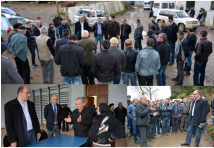
სახალხო დამცველის შეხვედრები ხულოსა და ხელვაჩაურის სოფლებში

დაუბალანსებელია ხელფასები, ხოლო მშენებლობის პროცესში არ ხდება ადგილობრივთა ინტერესების გათვალისწინება.