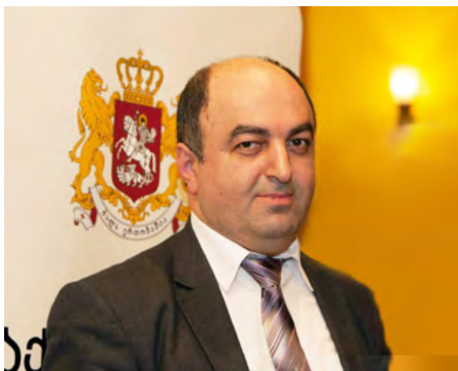
საქართველოს სახალხო დამცველი გიორგი ნანსახვილი

მარტის თვეში საპარლამენტო ანგარიშზე დაძაბული მუშაობის შემდეგ აპრილში ბავშვთა უფლებრივი მდგომარეობის შესახებ ორი სპეციალური ანგარიში წარმოვადგინეთ.