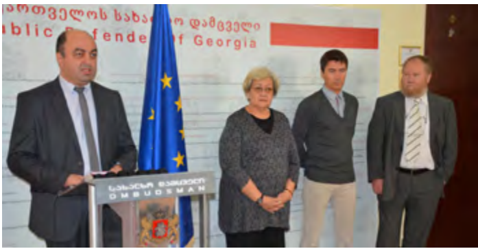
სახალხო დამცველი და საერთაშორისო მრჩეველთა საბჭოს პრეზიდენტი

ურჩა ნანუაშვილმა ჟურნალისტების წინაშე ზოგადად მიმოიხილა ექსპერტთა საბჭოს გასული წლის რეკომენდაციები და მათი შესრულების შედეგები. საბჭოსთან თანამშრომლობითა და მათი რჩევების საფუძველზე სახალხო დამცველმა არაერთი კვლევა ჩაატარა და რამდენიმე ანგარიში მოამზადა კონფლიქტურ რეგიონებში ადამიანის უფლებათა და თავისუფლებათა მდგომარეობის შესახებ, ასევე გააქტიურა თანამშრომლობა ადამიანის უფლებათა დაცვის საერთაშორისო ორგანიზაციებთან.