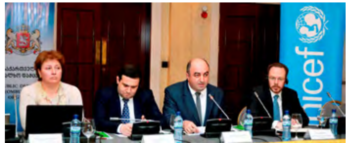
ბავშვთა უფლებრივი მდგომარეობის შესახებ ანგარიშების პრაქტიკაში

მონიტორინგმა გვიჩვენა, რომ საბავშვო ბაგა—ბაღების აღსაზრდელთა მნიშვნელოვანი ნაწილი ფსიქოლოგიურ ძალადობას განიცდის, შედარებით დაბალია ფიზიკური ძალადობის ფაქტები. ამასთან, საბავშვო ბაგა—ბაღების დიდი ნაწილი ფუნქციონირებს არასათანადო ინფრასტრუქტურული და სანიტარულ—ჰიგიენური გარემოს პირობებში. ასევე გამოიკვეთა ადრეული და სკოლამდელი განათლების უფლების პრაქტიკაში დანერგვის პრობლემები, აღმზრდელ—პედაგოგთა კვალიფიკაციის ამალღების საჭიროება; არატოლერანტული და დისკრიმინაციული დამოკიდებულება შშმ აღსაზრდელთა მიმართ. სკოლამდელი სააღმზრდელო დაწესებულების ნაწილში არასათანადოდ არის დაცული კვების ორგანიზაციული წესების სტანდარტი.