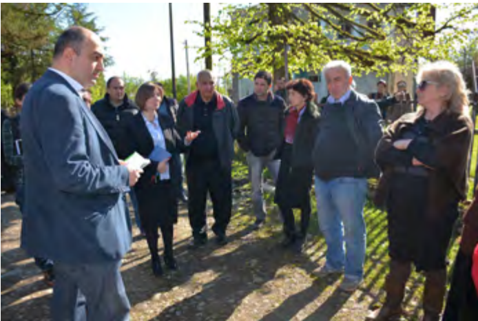
შახველრა სოფელ ჭანჭათის მოსახლეობასთან

ლანჩხუთის რაიონის სოფელ ჭანჭათში მწვავედ დგას სასმელი წყლის, გაზიფიცირების საკითხი; საგზაო ინფრასტრუქტურის არ არსებობის გამო მოსახლეობას უჭირს პროდუქტების მომარაგება, ვერ ახერხებენ სარეალიზაციოდ მოსავლის ტრანსპორტირებას; ხოლო ზემო ჭანჭათის მოსახლეობას უგზობობის გამო ვერც სასწრაფო სამედიცინო დახმარების მანქანა ემსახურება.