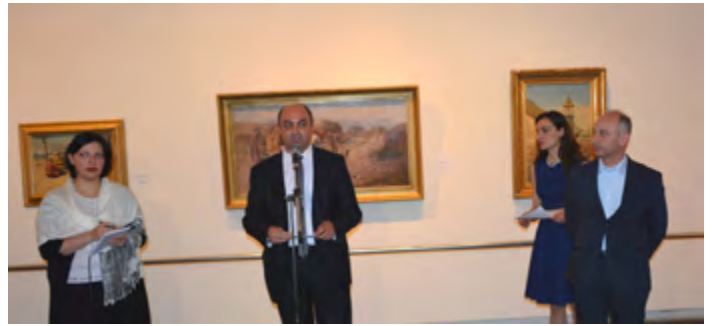
ტოლერანტობის ცენტრის 10 წლისთავი ხელოვნების მუზეუმში

ექსპოზიციისა და „საქართველოს ეთნიკური და რელიგიური მრავალფეროვნება მხატვრობაში“, წარმოდგენილი იყო საქართველოს ეროვნულ მუზეუმსა და კერძო კოლექციებში დაცული 115 ნამუშევარი, რომლებიც XIX-XXI საუკუნეებში საქართველოში მოღვაწე სხვადასხვა ეთნოსის წარმომადგენელ მხატვართა მიერ არის შესრულებული და საქართველოს მრავალფეროვნული და მრავალკონფესიური კულტურულ ტრადიციებს ასახავს.