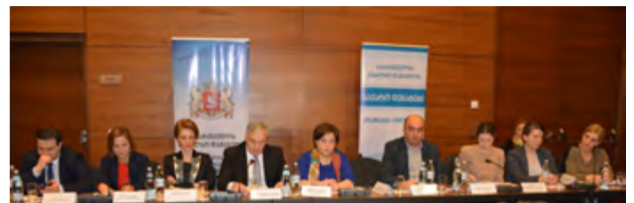
საჯარო დებატები სასტუმრო „რედისონ ბლუ ივერიაში“