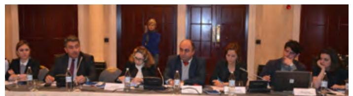
პრაივანთა სასტუმრო „თხილსი მერიოტში“

9 მარტს „სათანადო საცხოვრებლის უფლებაზე“ საქართველოს სახალხო დამცველმა სპეციალური ანგარიში წარმოადგინა. ანგარიშში განხილულია საკანონმდებლო და პრაქტიკულ დონეზე არსებული სისტემური და ინდივიდუალური ხასიათის პრობლემები, რომლებიც სახალხო დამცველის აპარატში უსახლკარო პირების საცხოვრებლით უზრუნველყოფასთან დაკავშირებით მიღებული გაცხადებების შესწავლის შედეგად გამოვლინდა.