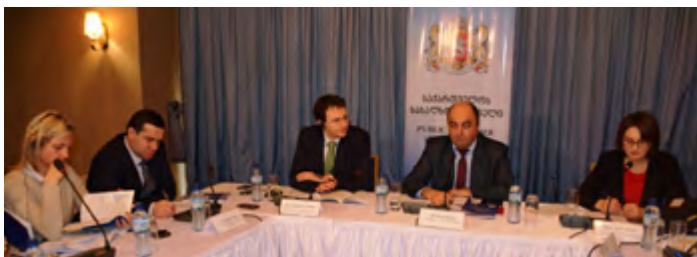
პრეზენტაცია სასტუმრო „ტიფლის პალასში“

16 მარტს საქართველოს სახალხო დამცველმა წარმოადგინა სპეციალური ანგარიში „საქართველოში მცხოვრები ოსური თემის მიგრაცია და მოქალაქეობასთან დაკავშირებული ცალკეული პრობლემები“. ევროპის საბჭოს ფინანსური მხარდაჭერით მომზადებული ანგარიში დაფუძნებულია 2014 წელს ჩატარებულ კვლევაზე, რომლის მიზანი იყო 1991—1993 წლებში შეიარაღებული კონფლიქტებისა და ეთნიკური დაძაბულობის დროს ადამიანის უფლებების დარღვევის ფაქტების შესწავლა და დარღვეული უფლებების აღდგენისათვის აუცილებელი რეკომენდაციების შემუშავება.