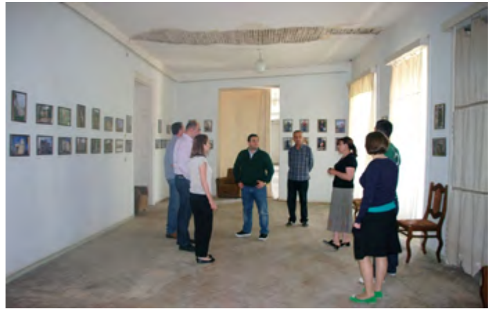
ონის მხარეთმცოდნეობის მუზეუმი სავალდებულო მდგომარეობაშია

24 მარტს საქართველოს სახალხო დამცველმა რეკომენდაციით მიმართა კულტურისა და ძეგლთა დაცვის მინისტრს განახორციელოს სათანადო ღონისძიებები ონის მხარეთმცოდნეობის (ისტორიული) მუზეუმის ახალი შენობით უზრუნველსაყოფად, რათა არ იქნას უგულებელყოფილი კულტურული თვითმყოფადობის პატივისცემის პრინციპი, რომელიც თავის თავში მოიცავს მუზეუმისთვის მატერიალურ/ტექნიკურ მხარდაჭერას სათანადო ინფრასტრუქტურით და ასევე, თითოეული მოქალაქის კულტურული ფასეულობებით სარგებლობის უფლებას.