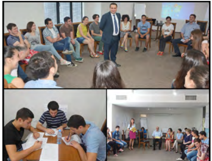
მონაწილეებმა დემოკრატიული განვითარების მნიშვნელობის, კონსტიტუციის მშვიდობიანი ტრანსფორმაციისა და საოქალაქო აქტივიზმის შესახებ საზაფხულო სკოლა მიიღეს.

10—16 ივლისს საქართველოს სახალხო დამცველისა და ადამიანის უფლებათა ცენტრის ერთობლივი პროექტის ფარგლებში ადამიანის უფლებების საზაფხულო სკოლის ტრენინგებში ჩატარდა, რომელშიც შიდა ქართლის, სამეგრელოს, ასევე ეთნიკური უმცირესობებით დასახლებული სამცხე-ჯავახეთისა და ქვემო ქართლის რეგიონებიდან შერჩეულმა 15-20 წლის ახალგაზრდებმა მიიღეს მონაწილეობა.