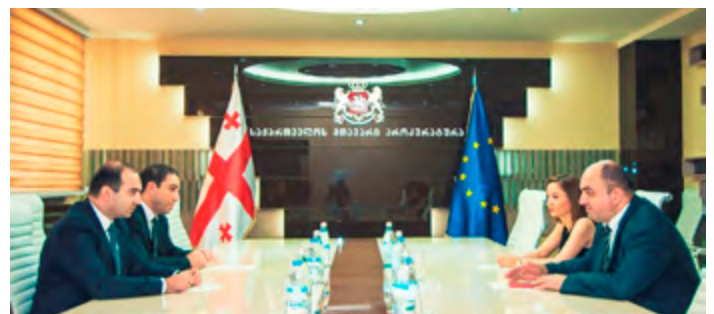
შეხვედრა მთავარ პროკურორთან

31 ივლისს საქართველოს სახალხო დამცველის უჩა ნანუაშვილის ინიციატივით შეხვედრა გაიმართა საქართველოს მთავარ პროკურორთან გიორგი ბადაშვილთან, რომელსაც სახალხო დამცველის მოადგილე ნათია კაციტაძე და მთავარი პროკურორის პირველი მოადგილე ირაკლი შოთაძე ესწრებოდნენ.