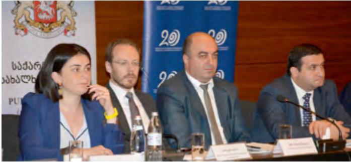
მსგ ბავშვთა სახლავის მონიტორინგის შედეგების პრეზენტაცია

განხორციელება, ბავშვთა სიღარიბე და ცხოვრების არასათანადო დონე, ჩვილ ბავშვთა სიკვდილიანობა, საქართველოს მაღალმთიან რეგიონებში მცხოვრებ ბავშვთა, სკოლამდელ სააღმზრდელო დაწესებულებების აღსაზრდელობა და მიუსაფარ ბავშვთა თავშესაფრით უზრუნველყოფის ქვეპროგრამის ბენეფიციართა უფლებრივი მდგომარეობა.