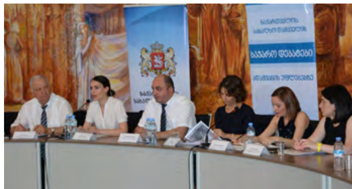
დებატები თბილისის სახელმწიფო უნივერსიტეტის აუდიტორიაში გაიმართა