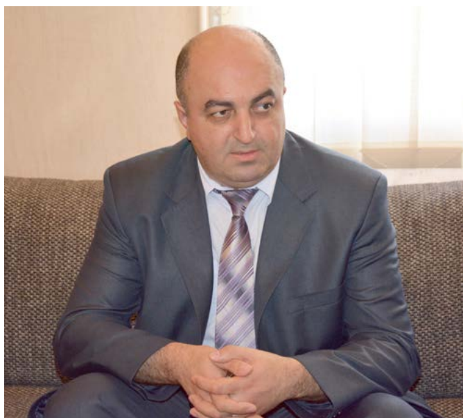
საქართველოს სახალხო დამცველი უკა ნაშაშვილი

აპრილის განსაკუთრებულ მოვლენათა შორის მინდა საერთაშორისო მრჩეველთა საბჭოს წევრთა ვიზიტი გამოვყო. მრჩეველთა საბჭოს შექმნა ჩვენი 2013 წლის სამოქმედო სტრატეგიული გეგმის ნაწილი იყო. საბჭოს მიზანია დაეხმაროს სახალხო დამცველს ადამიანის უფლებათა დაცვის სფეროში პრიორიტეტებისა და პერსპექტივების განსაზღვრა-განხორციელებაში.