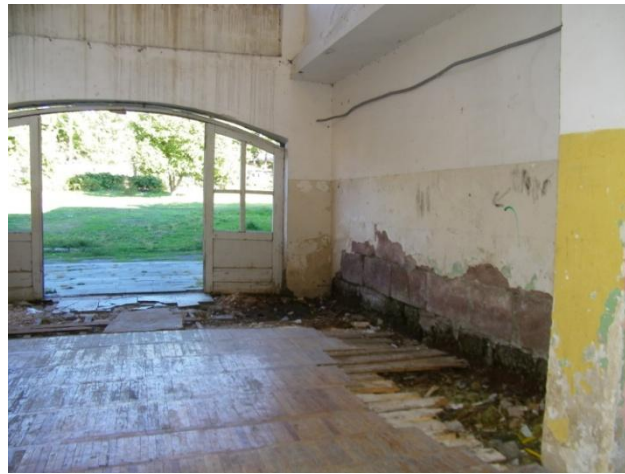
საბავშვო ბაღის შესასვლელი, რომლითაც იქ მცხოვრებლები სარგებლობენ

სახალხო დამცველის წარმომადგენლებთან საუბრისას მოსახლეობა აცხადებს, რომ უსაფრთხოების უზრუნველყოფისა და სოციალურ-ეკონომიკური პირობების გაუმჯობესების შემთხვევაში, მზად არიან დაბრუნდნენ ზარდიაანთკარში.