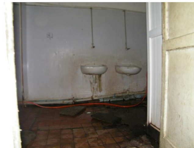
საპირფარეშო, რომლითაც საბავშვო ბაღში მცხოვრებლები სარგებლობენ

მოსახლეობისთვის განკუთვნილი საცხოვრებელი ფართი სავალალო მდგომარეობაშია: მოშლილია სველი წერტილები, გაფუჭებულია იატაკი, დერეფნებს არ აქვს ფანჯრები, თითო ოჯახისთვის გათვალისწინებულია მხოლოდ ერთი ოთახი, რომელიც არის სამზარეულოც, საძინებელიც, მისაღებიც. იმის გამო, რომ ზარდიაანთკარი საქართველოს ხელისუფლების მიერ კონტროლირებად ტერიტორიას მიეკუთვნება, საბავშვო ბაღში მცხოვრებ მოსახლეობას არ აქვს იძულებით გადაადგილებულ პირთა სტატუსი და შესაბამისად, ვერც თანმდევი სოციალური პაკეტით სარგებლობს.