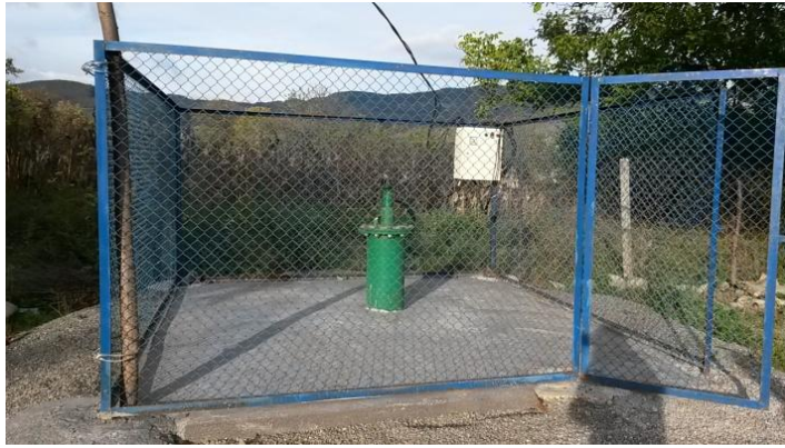
ახლად დამონტაჟებული ჭაბურღილი

6-წლიანი უწყლობის გამო მოსახლეობამ ვედარ შეძლო ბაღებისა და ნაკვეთების დამუშავება, ხეხილი გახმა და ადგილობრივებმა მთავარი შემოსავლის წყარო დაკარგეს. რეგიონული განვითარებისა და ინფრასტრუქტურის სამინისტროს ცნობით, საირიგაციო სისტემის მოწესრიგების საპროექტო სამუშაოები უკვე დასრულებულია, შესაბამისად, 2015 წლის ზაფხულის პერიოდისთვის მოეწყობა სატუმბი სადგურები და დაიწყება სასოფლო-სამეურნეო სავარგულების ირიგაცია.