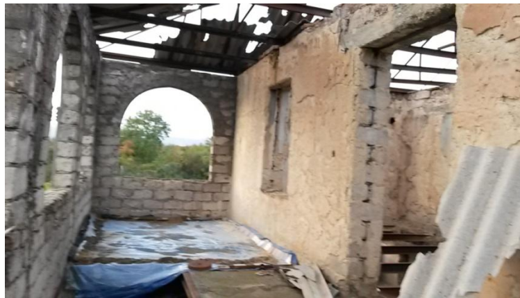
ჟ. გ.-ს სახლის მეორე სართული. წითელი ჯვრის მიერ მოწყობილი ოთახი პირველ სართულზეა, „ცელოფნიანი ფართის“ ქვემოთ.

2013 წელს, საყოფაცხოვრებო პირობების გაუმჯობესების მიზნით, სოფელ ზარდიაანთკარში დარჩენილ ოჯახებს თითო ოთახი გაურემონტა საერთაშორისო წითელი ჯვრის კომიტეტმა. 2014 წლის სექტემბერ-ოქტომბერში, სახალხო დამცველის აპარატის წარმომადგენელთა მონიტორინგის დროს კი გამოვლინდა, რომ რეაბილიტირებულ ოთახთა უმეტესობა კვლავ შესაკეთებელია, რადგან დაზიანებული სახურავებიდან წყალი ამ ოთახებშიც აღწევს.