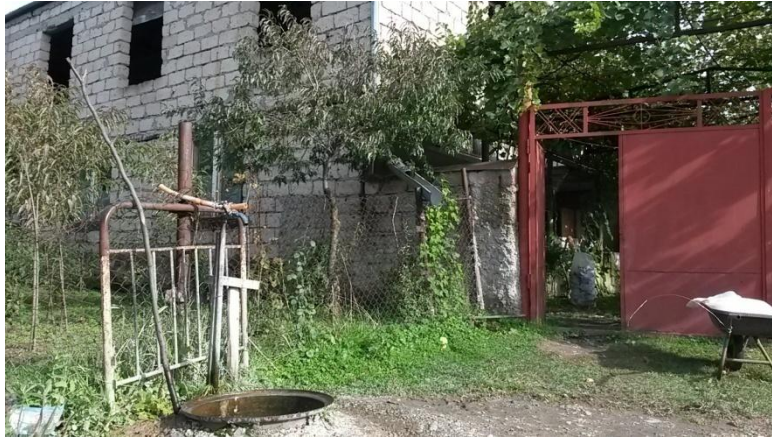
ონკანი, რომლითაც მოსახლეობა წყალს იმარაგებს

სოფელში დღემდე რჩება სასმელი და სარწყავი წყლის პრობლემა. მონიტორინგის შედეგად გამოვლინდა, რომ აქ სასმელი წყლის მხოლოდ ერთი ონკანია და ისიც ქართველი სამართალდამცავების მიერ კონტროლირებადი ტერიტორიის მიღმა მდებარეობს. ამ ონკანთან წყლის მოყვანა ეთნიკურად ოსი მოსახლის კერძო ინიციატივის შედეგია, რომელმაც დაახლოებით ერთ კილომეტრიანი არხი გათხარა. ზარდიაანთკარის ყველა მოსახლე სასმელ წყალს სწორედ ამ ონკანიდან იმარაგებს.