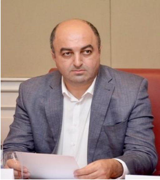
საქართველოს სახალხო დამცველი უჩა ნანუაშვილი

პრევენციის ეროვნული მექანიზმის N4 ბიულეტენი შეიცავს მნიშვნელოვან ინფორმაციას ჩვენს მიერ ზამთრის განმავლობაში განხორციელებული აქტივობების შესახებ.