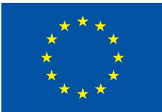
პროექტი დაფინანსებულია ევროკავშირის მიერ