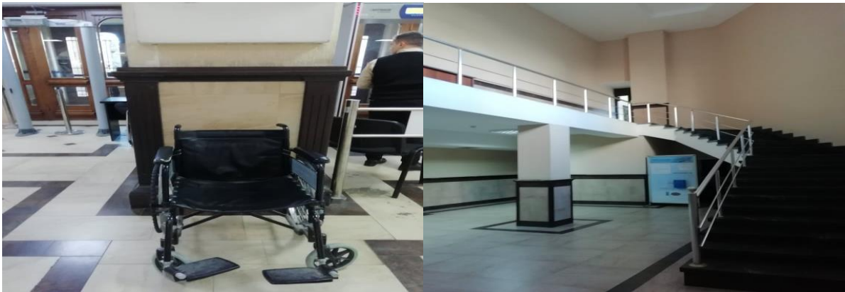
*მოსაცდელი სივრცეები თბილისის საქალაქო სასამართლოში.

სასამართლო შენობის „ფოიეში“ განთავსებულია რუკა რომელიც განსაზღვრავს დარბაზებამდე მისასვლელი გზის ტრაექტორიას. დერეფნებში ასევე განთავსებულია უსაფრთხოების საევაკუაციო რუკები. არასრულწლოვნების საჭიროებებზე მორგებული რაიმე სახის ბროშურები/ბუკლეტები არ არის განთავსებული ფოიეში.