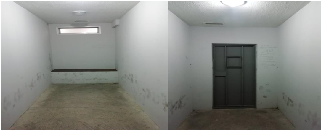
*პატიმრობაში მყოფი არასრულწლოვნების დროებითი განთავსების ოთახები თბილისის საქალაქო სასამართლოში.

იღება. ოთახში დამონტაჟებულია ვენტილაცია. ერთ-ერთ კედელთან ამოშენებულია ტახტის მსგავსი დასაჯდომი, რომელზეც დამაგრებულია ხის ზედაპირი. კედლებზე შეინიშნება ნაფეხურები, არის წარწერები. ამავე საკნებში ათავსებენ ქალებს, აგრეთვე, დამკვიდრებული პრაქტიკის შესაბამისად, სექსუალური უმცირესობის წარმომადგენელ პატიმრებს. თუმცა, არასრულწლოვანი ყოველთვის თავსდება ცალკე. ამ სამი ოთახის გვერდით განთავსებულია საპირფარეშო, რომელიც არ არის ადაპტირებული შშმ პირთათვის. საპირფარეშოში ჰიგიენური ნორმები დამაკმაყოფილებელია. ადგილი, სადაც განთავსებულია ეს სამი ოთახი, გამოყოფილია და ცალკეა იმ ფართისგან, სადაც განლაგებულია სრულწლოვანი პირებისთვის განკუთვნილი საკნები. ეს ორი ფართი კიბეებით უკავშირდება ერთმანეთს. ანუ, არასრულწლოვნებისთვის განკუთვნილი საკნები იზოლირებულია სრულწლოვანი პირებისთვის განკუთვნილი საკნებისგან. იმ შემთხვევაში, თუ პატიმრობაში მყოფი ბრალდებული, მათ შორის არასრულწლოვანი, არის შშმ პირი და გადაადგილდება ეტლით, შენობაში შეყავთ სხვა შესასვლელით, რომელიც ადაპტირებულია, ანუ მოწყობილია პანდუსი. ეს შესასვლელიც შენობის უკანა მხარეს არის და უკავშირდება დარბაზებს. შესასვლელში არ არის რაიმე ხელისშემშლელი არქიტექტურული ბარიერი.