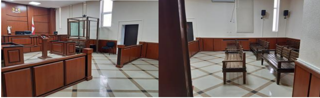
*სხდომათა დარბაზები ქუთაისის საქალაქო სასამართლოში.