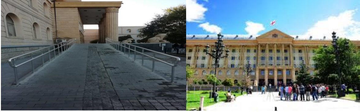
*თბილისის საქალაქო სასამართლოს შესასვლელი.

სასამართლოს აქვს ასევე ცალკე შესასვლელი მხოლოდ პატიმრობაში მყოფი არასრულწლოვნებისთვის. ეს შესასვლელი განთავსებულია შენობის უკანა მხარეს. არის ადაპტირებული შესასვლელი, რომელიც უშუალოდ უკავშირდება მე-12, მე-13 და მე-14 დარბაზებს. თუმცა აღნიშნული შესასვლელები გამოიყენება, როგორც სრულწლოვნებისთვის, ასევე არასრულწლოვნებისთვის. ამ შემთხვევაში ადაპტირებული მოსაცდელი ოთახი არ არსებობს. აღნიშნული შესასვლელი, არ არის ადაპტირებული შშმ პირთა საჭიროებების მიმართ, კერძოდ ეტლით მოსარგებლე პირებისთვის.