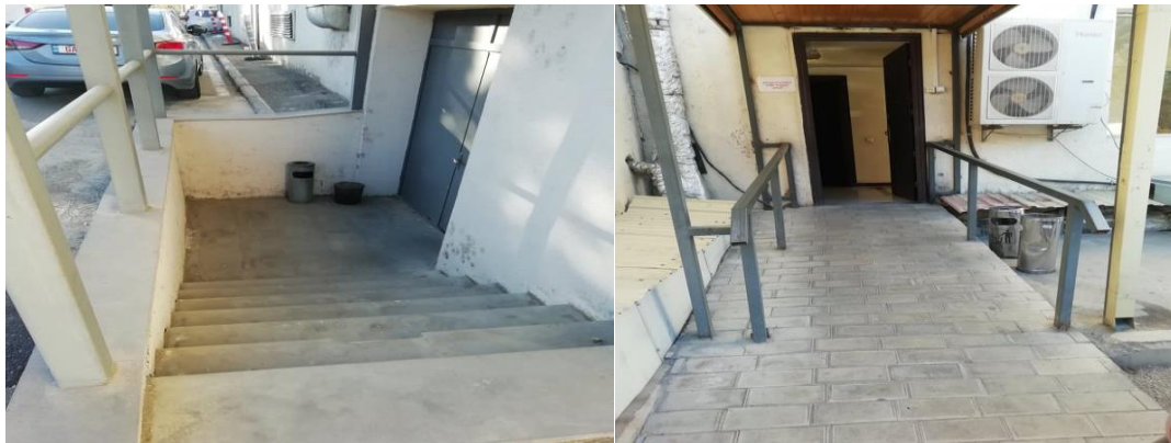
*თბილისის საქალაქო სასამართლოს შესასვლელი პატიმრობაში მყოფი არასრულწლოვნებისთვის.

სასამართლოს აქვს ასევე ცალკე შესასვლელი მხოლოდ პატიმრობაში მყოფი არასრულწლოვნებისთვის. ეს შესასვლელი განთავსებულია შენობის უკანა მხარეს. არის ადაპტირებული შესასვლელი, რომელიც უშუალოდ უკავშირდება მე-12, მე-13 და მე-14 დარბაზებს. თუმცა აღნიშნული შესასვლელები გამოიყენება, როგორც სრულწლოვნებისთვის, ასევე არასრულწლოვნებისთვის. ამ შემთხვევაში ადაპტირებული მოსაცდელი ოთახი არ არსებობს. აღნიშნული შესასვლელი, არ არის ადაპტირებული შშმ პირთა საჭიროებების მიმართ, კერძოდ ეტლით მოსარგებლე პირებისთვის.