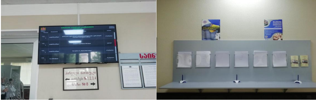
*რუსთავის საქალაქო სასამართლოს მოსაცდელი სივრცე და საინფორმაციო დაფები.