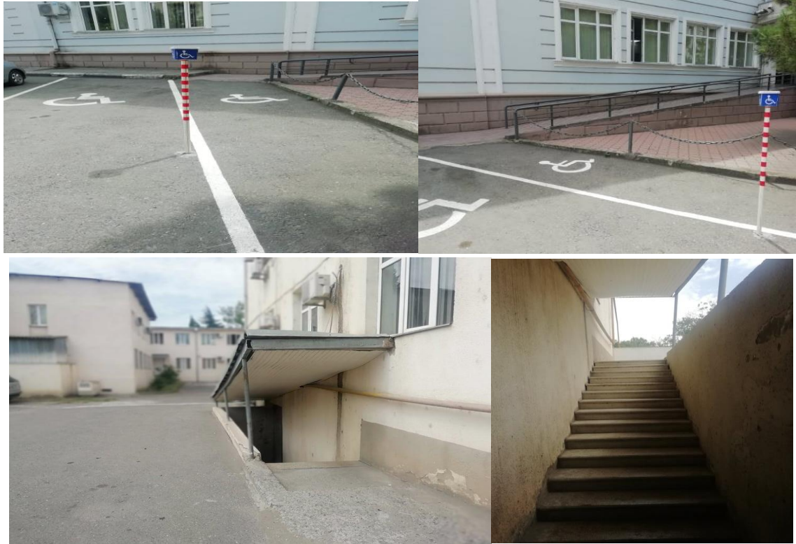
*რუსთავის საქალაქო სასამართლოს შესასვლელი.

შენობაში ბევრი დაბრკოლებაა ეტლით მოსარგებლე პირებისთვის. შენობა აღჭურვილი არ არის ლიფტით და სართულებს შორის გადაადგილება შესაძლებელია მხოლოდ კიბეების საშუალებით. მეორე სართულზე შედარებით ნაკლებ დაბრკოლებას ვხვდებით, იმის გათვალისწინებით, რომ პანდუსის გავლით ვხვდებით ძირითად შესასვლელთან და შემდგომ „ფოიეში“, რომელიც მეორე სართულზეა და ამ სართულის დარბაზებთან მისვლა დაუბრკოლებლად არის შესაძლებელი. თუმცა ამ სართულზე არსებულ საპირფარეშოში მოსახვედრად ასევე არის გარკვეული დაბრკოლებები. როგორც სასამართლოს თანამშრომლებმა განმარტეს, თუ პროცესის მონაწილე პირი ეტლით მოსარგებლეა, ან შშმ პირია, პროცესი ინიშნება მეორე სართულზე მდებარე დარბაზში. შშმ პირების დახვედრა და სასამართლოს დარბაზამდე მიცელების პროცესი, მოწესრიგებულია სასამართლოს თავმჯდომარის შიდა ბრძანებით.