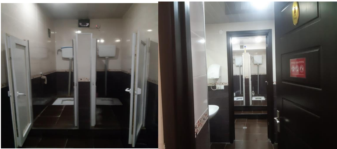
*ქუთაისის საქალაქო სასამართლოს საპირფარეშოები.

საპირფარეშო განლაგებულია 0 სართულზე, შესაბამისად, ეტლით მოსარგებლე პირისთვის მისაწვდომი არ არის კიბეების გამო (ლიფტი არ არის). ასეთ შემთხვევებში მანდატურების დახმარებით ხდება ეტლით მოსარგებლე პირის საპირფარეშომდე მიყვანა. მონიტორინგისას ასევე გამოიკვეთა, რომ საპირფარეშოს ადაპტირების საკითხი დღის წესრიგშია, თუმცა კონკრეტულად როდის მოგვარდება უცნობია.