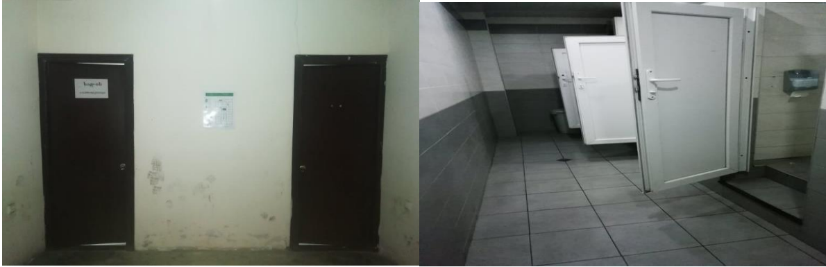
*რუსთავის საქალაქო სასამართლოს საპირფარეშოები.