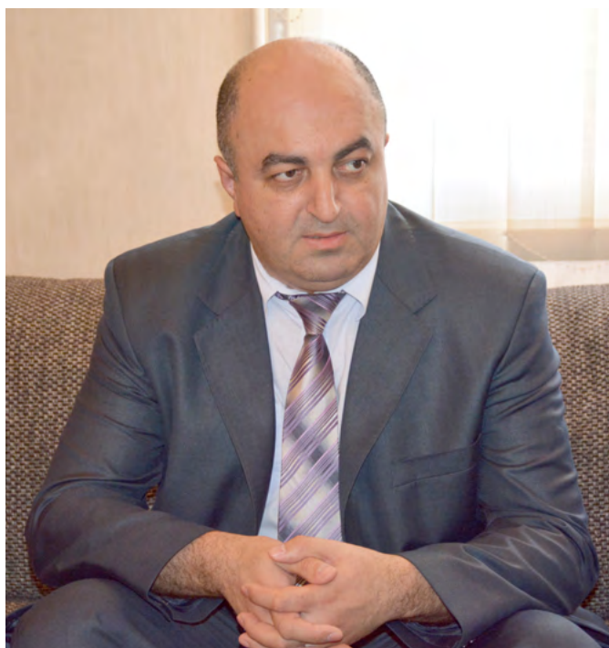
საქართველოს სახალხო დამცველი ურა ნანუაშვილი

აპრილში საქართველოს სახალხო დამცველის აპარატის დაარსების ოცი წლისთავი აღვნიშნეთ და ამ ფაქტთან დაკავშირებით საერთაშორისო კონფერენცია გავმართეთ თემაზე – „ადამიანის უფლებათა მრავალმანდატიანი ეროვნული ინსტიტუტების ევოლუცია და გამოწვევები“.